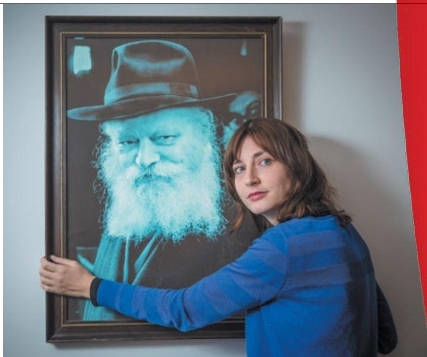
שינה את חייה. לצד תמונתו של הרבי מלובביץ'